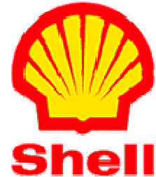
Exemplo de logomarca:

A logomarca é versão gráfica do nome da marca. Isso acontece quando associamos à marca alguma imagem, símbolo, sinal ou desenho gráfico. À essa associação dá-se o nome de logomarca, apelidada de “logo”.